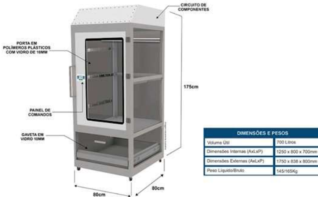
Figura 3 - Câmara Ciano Safe Expert BV-360/700.

Para a aquisição de Câmara de Ninidrina/DFO a pesquisa resultou: