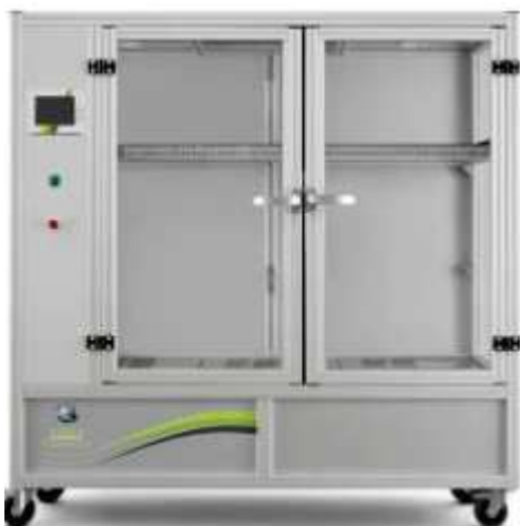
Figura 2 - Câmara Vaporizadora TopAir.