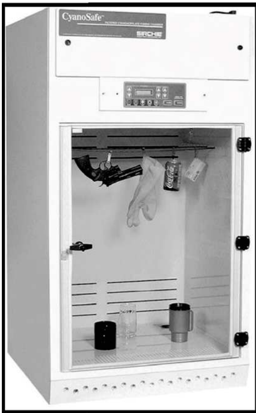
Figura 1 - Câmara CyanoSafe™ da Sirchie.